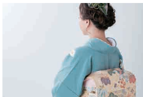
他呉服店との加盟店契約

当期は割賦事業での他社展開も実行 将来的なグループの収益増加へ さらに寄与できる体制の構築へ