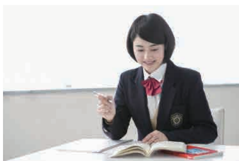
タレント養成学校・学習教材業者 との加盟店契約