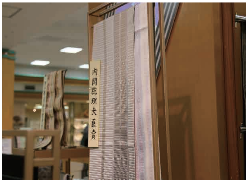
はかた匠工芸製の袋帯 「手織 弥三右衛門間道（やざえもんかんどう）」 新作博多織展最高賞の内閣総理大臣賞を受賞！