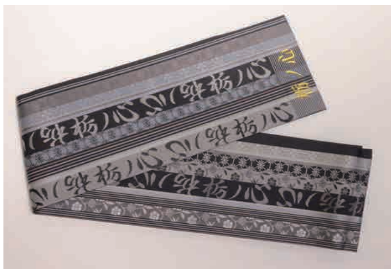
ジョージア出身の新大関・栃ノ心に博多織の帯を進呈！