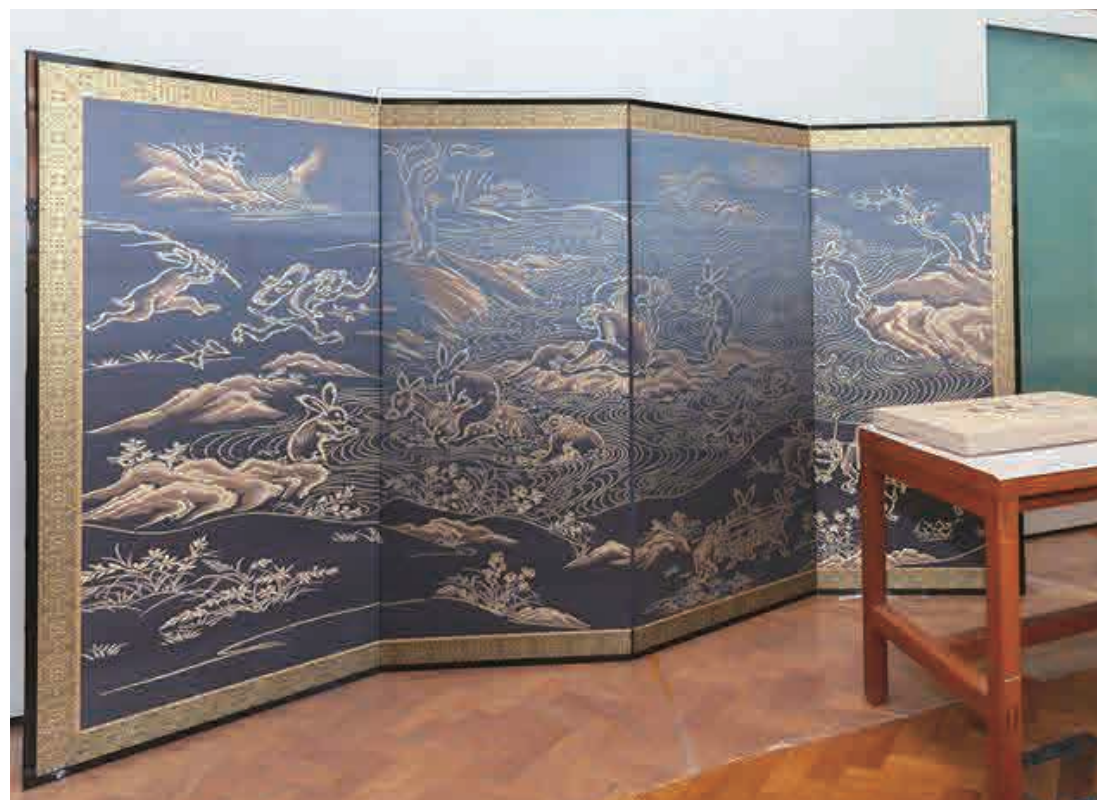
英・ロンドンの国立ビクトリア・アンド・アルバート 博物館に博多織の屏風「鳥獣戯画」を寄贈！