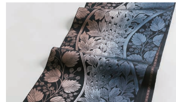
九州経済産業局長賞を受賞した「孔雀牡丹II」