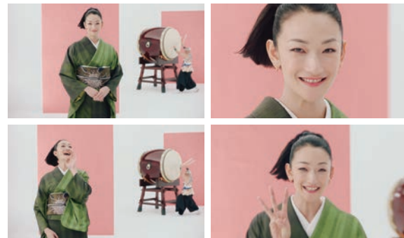
「三日坊主の人も飽きる前に終わっちゃう」「通わなくて正解だったかも」など印象的なメッセージも話題となりました。

今年は、きものを着てみたかったすべての方に、一歩踏み出すための「最高のきっかけ」をご用意しております。