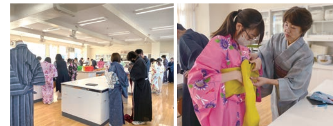
▲最初は戸惑いながらも楽しく着付けを学ぶ生徒さんたち。教師からも「実体験を伴った授業ができてありがたい」と好評です。

2022年6月から2023年12月までに、計53校、約6,130名の生徒に着付けの授業を行いました。今後も「きものを次世代につなぐための活動」を継続してまいります。