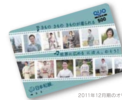
2011年12月期のオリジナルQUOカード のデザインは、日本和装の春のCMに出演 された10人の修了生モデルたちでした。