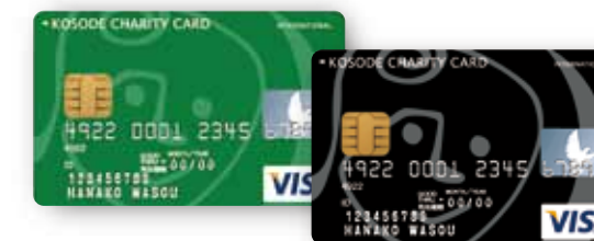
KOSODEチャリティーカードは日本和装 ホールディングス株式会社と株式会社 東京クレジットサービス(三菱UFJフィ ンシャル・グループ)との提携カードです。